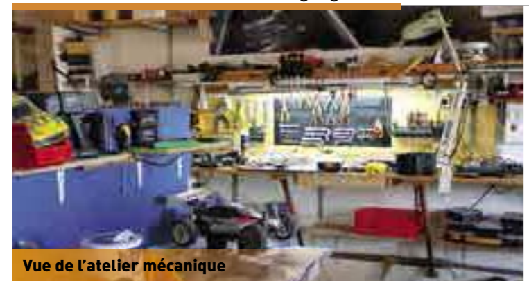
Vue de l'atelier mécanique