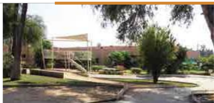
Piste Rallye Cross et plateforme de pilotage

Les pilotes passent beaucoup de temps à préparer leur bolide apprenant, ainsi, à les faire fonctionner, à prévenir les pannes et à peaufiner les réglages.