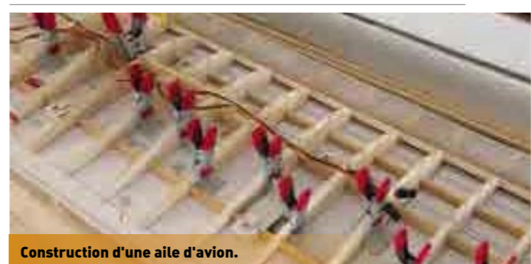
Construction d'une aile d'avion.

Nos ateliers se sont dotés d'une imprimante 3D qui possède bien d'autres fonctions comme : La découpe au fil chaud, la gravure, la découpe CNC, les dessins et capture de forme. La robotique fait de timides débuts chez nous mais sert surtout à la formation.