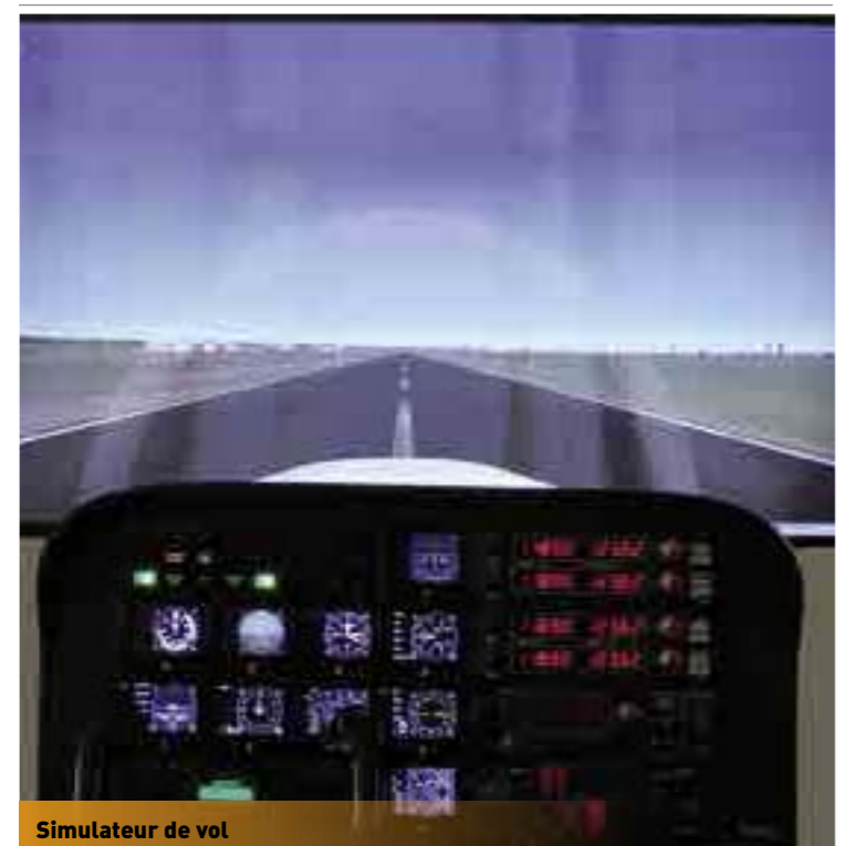
Simulateur de vol

Des journées portes ouvertes vont être organisées et, surtout, n'hésitez pas à nous visiter et à découvrir le petit monde du modélisme.